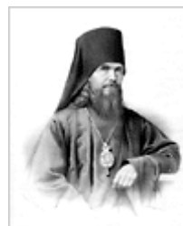
Свт. Феофан Затворник [23 янв., 29 июня н.ст.]

Миροносицы и апостолы - образ двух сторон нашей жизни: чувства и рассуждения. Без чувства жизнь не жизнь; без рассуждения - жизнь слепа, много истрачивается, а мало плода здравого дает. Надо сочетать то и другое. Чувство пусть идет вперед и возбуждает; рассуждение же пусть определяет время, место, способ, вообще бытовой строй того, что делать намекает сердце. Внутри сердце идет вперед, а на практике - рассуждение.